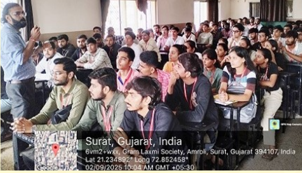
Surat, Gujarat, India 6vm2-wxk, Gram Laxmi Society, Amroli, Surat, Gujarat 394107, India Lat 21.234892° Long 72.852458° 02/09/2025 10:04 AM GMT +05:30